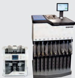
Sistemi di conteggio

Soluzioni modulari per il trattamento del denaro