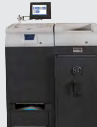
Dispositivi avanzati per la gestione del denaro