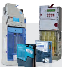
Gettoniere e rendiresto