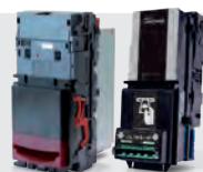
Lettori di banconote